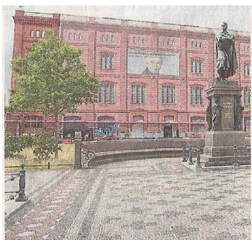
Der „rote Kasten“ am Werderschen Markt soll künftig ein Ort sein, in dem sich Forschung, Lehre und Handwerk präsentieren können.

Das Konzept des Fördervereins Bauakademie steht unter dem Motto „Internationales Zentrum für die nachhaltige Gestaltung von Lebensräumen“. Das Gebäude soll in seiner ursprünglichen äußeren Gestalt als ein Gebäude für nachhaltiges Bauen entstehen. Die Raumaufteilung im Inneren folgt dem historischen Raster und Proportionen, wobei dennoch funktional und gestalterisch künftig eine neutrale und individuelle nicht branchenbezogene Nutzung für Veranstaltungen, Ausstellungen und Büroräume sicherzustellen ist, als Internationales Innovations-, Ausstellungs-, Veranstaltungs- und Konferenzzentrum, dem Schinkelforum.